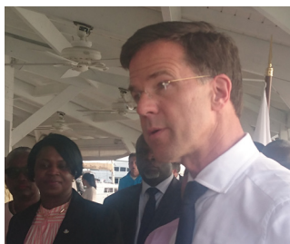
Mai 2018 La coopération avec les Pays-Bas à l'honneur

Mark Rutte , Premier ministre des Pays-Bas Raymond Knops , Secrétaire d'État aux affaires intérieures et aux relations du Royaume des Pays-Bas Leona Marlin- Romeo , Premier ministre de Sint-Maarten