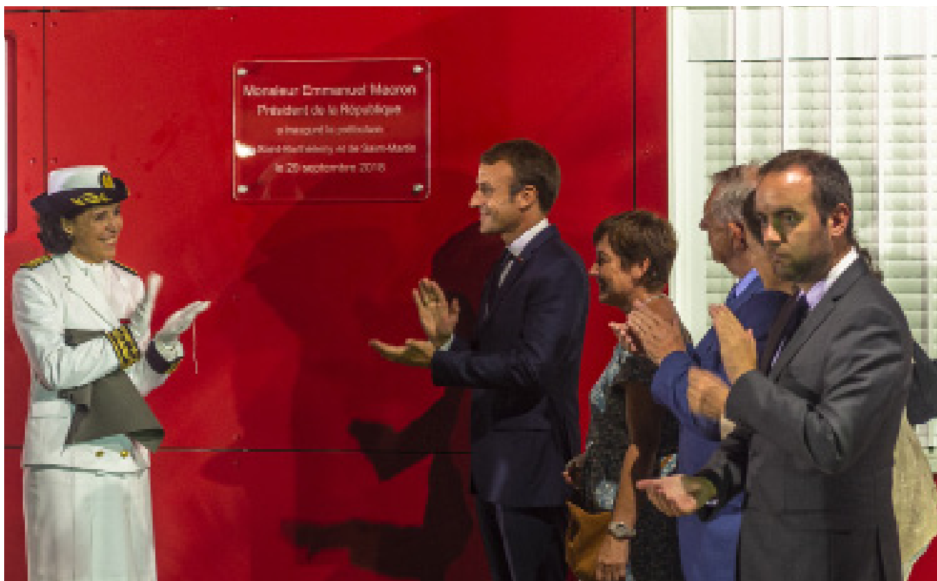
Samedi 29 Septembre 2018 : Inauguration des nouveaux locaux de la Préfecture de Saint-Barthélemy et de Saint-Martin situés au 23 rue de Spring, à Concordia.