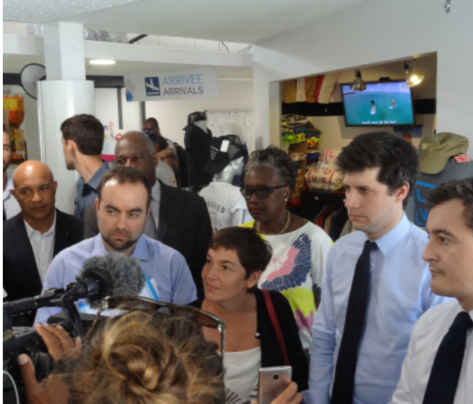
Mars 2018 Accompagner la reconstruction

Annick Girardin , Ministre des Outre-mers Gerald Darmanin , Ministre de l'Action et des comptes publics Sébastien Lecornu , Secrétaire d'État auprès du Ministre d'État, Ministre de la transition écologique et solidaire Julien Denormandie , Secrétaire d'État auprès du Ministre de la cohésion des territoires