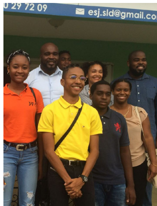
Jean-Marc Mormeck , délégué interministériel à l'égalité des chances